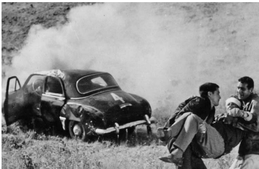
«До завтра». На съемках

воляли ему запирать ключом дверцы машины. Он просто хлопал дверью и уходил (справедливости ради скажем—машины тогда угоняли редко).