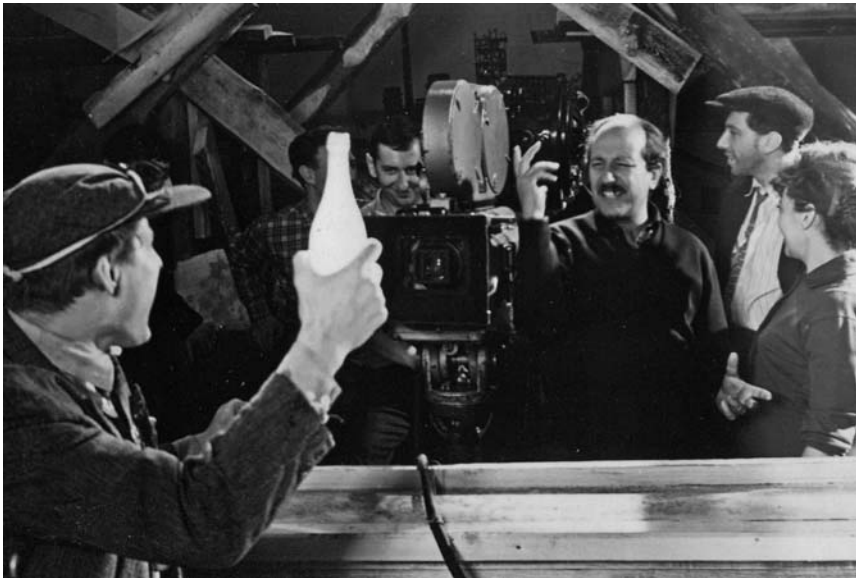
«Время, вперед!». Рабочий момент

было срочно закопать резервный кабель, чтобы никто на него случайно не наступил—это было очень опасно.