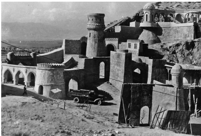
Декорация к фильму «Знамя кузнеца»

1929 году, еще когда шла война с басмачами, снимал первый в республике фильм) и долго убеждал не наносить ущерба внешней политике СССР.